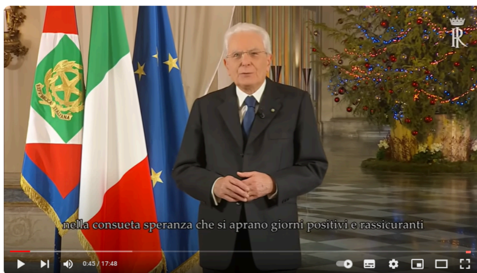
Messaggio di fine anno del Presidente della Repubblica Sergio Mattarella con sottotitoli